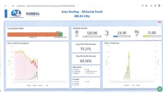
รูปที่ 2 แสดงการบันทึกผลปริมาณการใช้พลังงานแสงอาทิตย์และประสิทธิภาพของระบบ