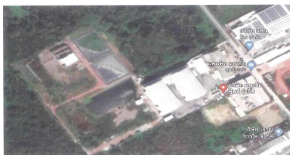
รูปที่ 1 แสดงขอบเขตพื้นที่การดำเนินโครงการ