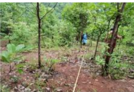
โครงการส่งเสริมและสนับสนุนการมีส่วนร่วมในการจัดการพื้นที่ป่าต้นน้ำเสื่อมสภาพ บนพื้นที่เขาสูงชันบ้านห้วยโหม่ หมู่ที่ 11 ตำบลชาน อำเภอน้ำหนาว จังหวัดน่าน