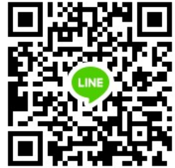
Group Line สสภ.+อบก.