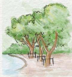
เข้าง่าย