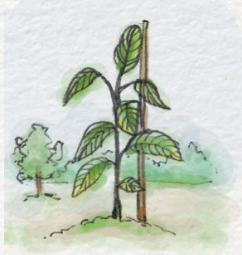
ต้นกล้า (ไม่เข้าง่าย)

ขนาดของต้นไม้ที่เข้าง่ายสำหรับการประเมินการกักเก็บคาร์บอนเพื่อการรับรองกิจกรรมภายใต้โครงการ LESS ต้องเป็นต้นไม้ที่มีขนาดเส้นรอบวงมากกว่า 15 ซม. และความสูงมากกว่า 1.30 เมตร